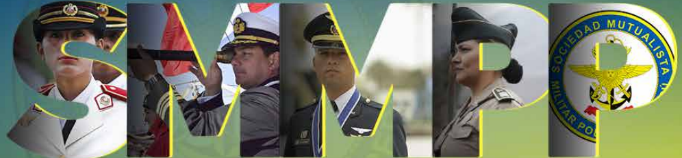
SOCIEDAD MUTUALISTA MILITAR POLICIAL DEL PERÚ